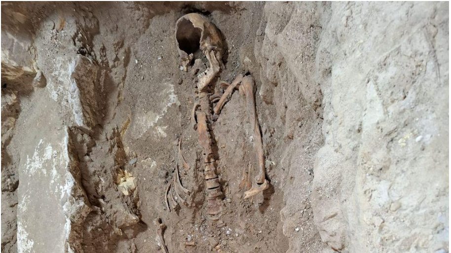
Het vermoedelijke graf van D' Artagnan dat bij Maastricht is blootgelegd