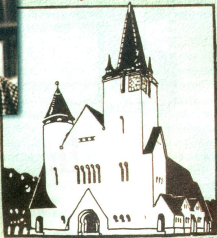
Biserica Reformată cu Cocos din Cluj

Personalitate a culturii și politicii maghiare din România, renumit arhitect cu o viziune proprie și originală pentru promovarea tradițiilor din Transilvania.