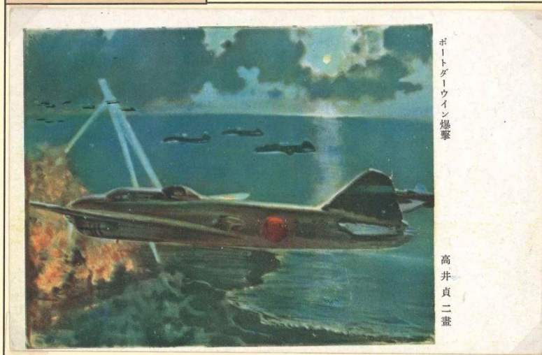
In februari 1942 volgt de aanval op de Australische marinebasis Darwin. 81 Nakajima B5N (op Japanse veldpostkaart over de aanval op Darwin) en 71 Aichi D3A Val-bommenwerpers (op zegel van Uganda) voeren de aanval uit. In de haven worden acht schepen onbruikbaar.

Deze inzending in rang 3 van de thematische klasse leverde André met 90 punten de bekroning Goud op. Wij hebben natuurlijk hoge verwachtingen van de verdere ontwikkeling van deze verzameling in de hogere klassen. Die verwachting is ingegeven door het feit dat André in 2013 al een keer Europees kampioen werd met zijn thematische inzending "Masks of the Universe".