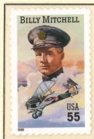
B-25 bommenwerper Mitchell

Al vroeg zijn er beelden bij het toekomstige luchtwapen. Bij de Haagse vredesconferentie in 1907 wordt het verbod op bombardementen op onverdedigde steden door enkele prominente landen niet ondertekend. Na zijn 'War of the Worlds' beschrijft Wells in 1907 een toekomstige luchtoorlog.