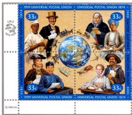
125 jaar UPU. Geëerd op VN-zegels uit1999.

al dik 130 jaar nu. Ze bepaalt tarieven, gewichten en afmetingen van poststukken. Ze stelt ook de regels vast voor aangetekende post, luchtpost en vervoer van bijzondere stoffen. Ook de UPU wordt bestuurd door vertegenwoordigers van alle landen.