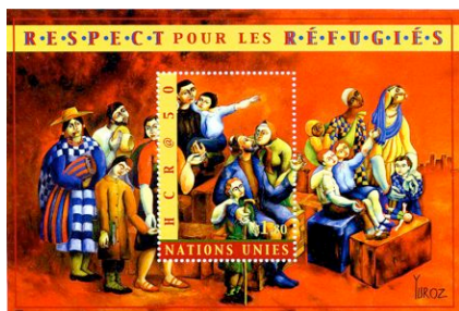
De zegels en vellen zijn veelal ontworpen en gemaakt door kunstenaars uit de hele wereld. Dit is een velletje uit het jaar 2000.

Het Verdrag geeft dus de basis zowel als het doel aan voor het