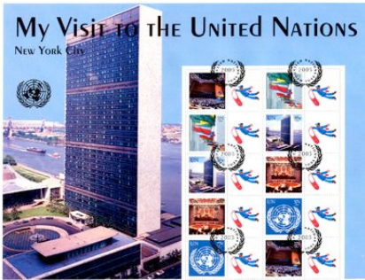
Een souvenirvel uit 2005. Links het hoofdgebouw in New York, rechts 10 postzegels met impressies van het gebouw en het logo.

Behalve het Gerechtshof dat in Den Haag zetelt, zijn alle andere organen gevestigd in New York.