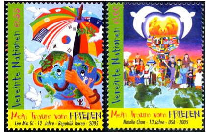
De zegels van Wenen, 2005