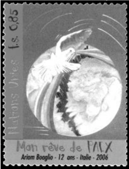
Geneve 0,85fr, 2006. Rechts, de 1,20fr zegel.

Wijzelf staan voortdurend voor de keuze: we kennen de momenten waarop we ons - in gedachten - met geweld tegen anderen keren. Maar we kennen ook de momenten waarop we innerlijk in rust verkeren. Het is goed hierover te peinen.