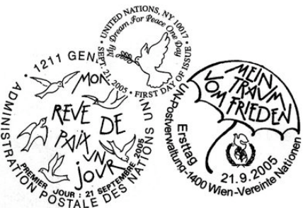
De eerstedag stempels van 2005

De zegel toont een groep mensen die op de aarde staan. Zij verbinden verschillende werelddelen. In hun midden staat een brandende toorts, gemaakt uit de vlaggen van de landen. Van de toorts uit vliegen twee duiven